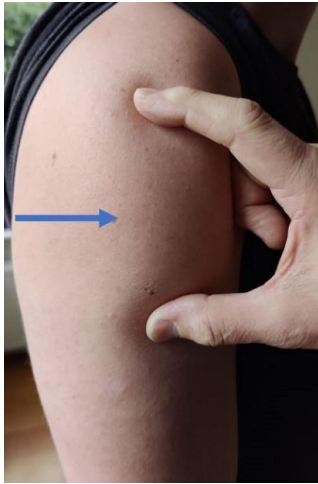
Figuur 1 plaats voor injectie.

Comirnaty wordt intramusculair (i.m.) toegediend in de bovenarm (m. deltoïdeus). Als er niet in de bovenarm gevaccineerd kan worden, kan de vaccinatie in het bovenbeen worden toegediend (m. vastus lateralis).